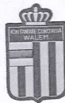
Badge op de mouw genaaid van de leden van Concordia

muziek en de samenhang in de fanfare dermate gegroeid dat zij met succes deelnemen aan festivals in Niel en Mechelen, waar zij telkens een zilveren medaille behalen. Meer nog, het vertrouwen was zo groot dat ze zelf op 28 augustus 1853 te Walem een festival inrichten waaraan negen fanfares en harmonies zullen deelnemen.