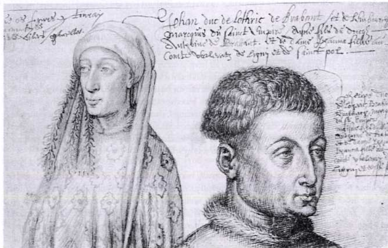
Jan IV en zijn jongere broer Philips van Saint-Pol Afbeelding door Antonio de Succa [18]

Tot zijn meerderjarigheid in 1418 (op de leeftijd van 15 jaar, naar het Ripuarische of middelfrankische gewoonterecht) stond Jan IV onder voogdij van een regentenraad, samengesteld uit leden van de Staten van Brabant. Deze raad regelde trouwens het huwelijk van Jan IV met Jacoba van Beieren, de weduwe van de Franse dauphin en gravin van Holland, Zeeland en Henegouwen. Het was de bedoeling om door deze echtverbintenis, die op 10 april 1418 te Den Haag voltrokken werd, een grote machtsconcentratie te doen ontstaan, maar uiteindelijk legde ze de basis voor de opslorping van deze vorstendommen door het Bourgondische huis. Jan IV raakte immers spoedig in onmin met Jacoba, onder meer omdat hij haar belangen van gravin van Holland en Zeeland onvoldoende verdedigde tegen de manipulaties van haar oom Jan van Beieren, elect 2/ van Luik. Bijgevolg vroeg Jacoba de paus om ontbinding van hun huwelijk. Het eigenzinnige beleid van Jan IV stuitte ook in de Brabantse steden op verzet. Toen Jacoba in april 1420 Jan IV verliet, kozen de Staten van Brabant dan ook partij voor haar, en beslisten ze op een bijeenkomst te Vilvoorde op 29 november 1420 om Jan's jongere broer Filips van Saint-Pol (° 1404 – † 1430) aan te stellen tot ruwaard van Brabant. Henegouwen ging naar een telg uit het huis van Luxemburg en Holland-Zeeland ging naar Filips van Bourgondië, graaf van Vlaanderen.