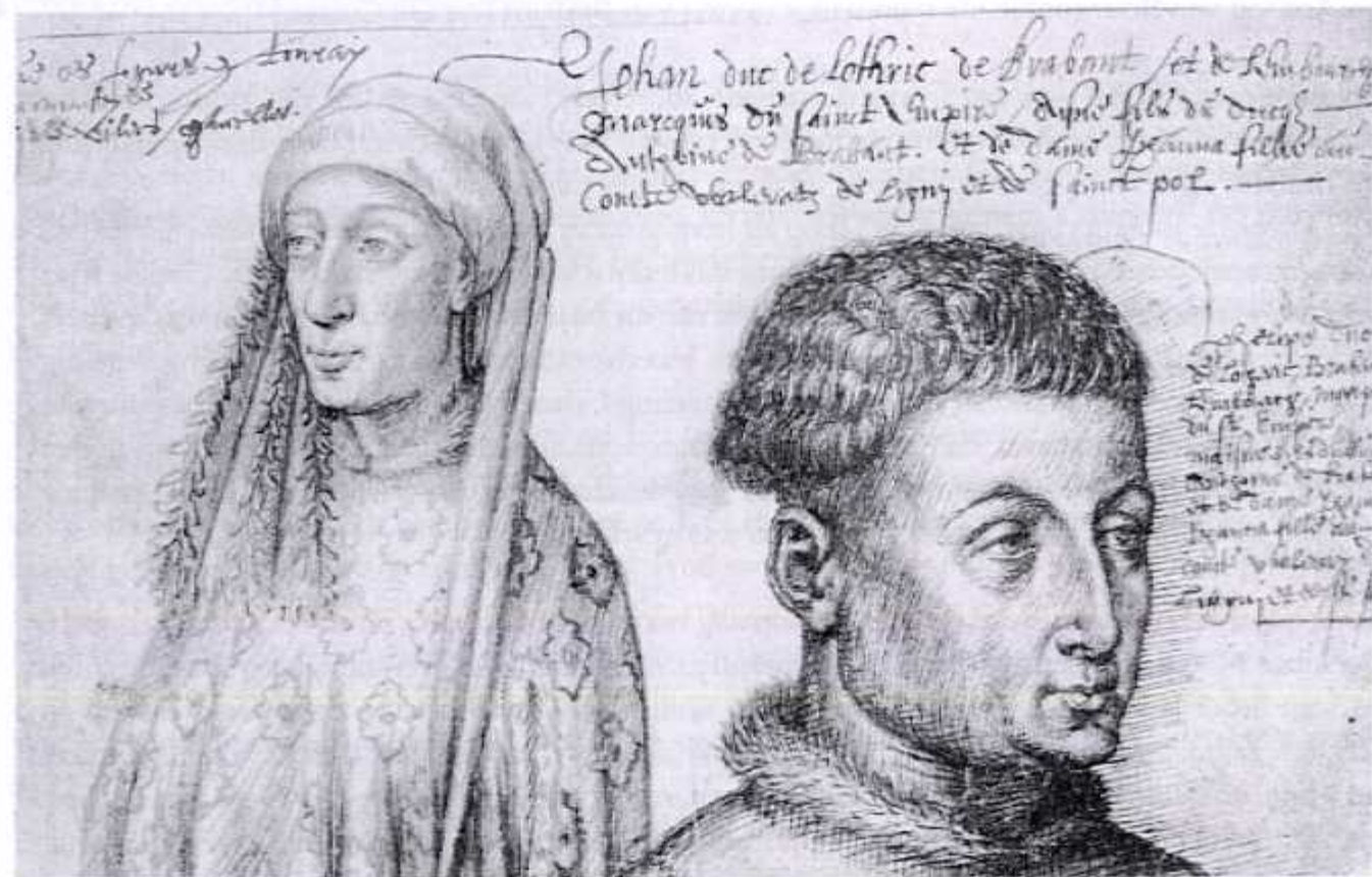
Jan IV en zijn jongere broer Philips van Saint-Pol Afbeelding door Antonio de Succa [18]

Tot zijn meerderjarigheid in 1418 (op de leeftijd van 15 jaar, naar het Ripuarische of middelfrankische gewoonterecht) stond Jan IV onder voogdij van een regentenraad, samengesteld uit leden van de Staten van Brabant. Deze raad regelde trouwens het huwelijk van Jan IV met Jacoba van Beieren, de weduwe van de Franse dauphin en gravin van Holland, Zeeland en Henegouwen. Het was de bedoeling om door deze echtverbintenis, die op 10 april 1418 te Den Haag voltrokken werd, een grote machtsconcentratie te doen ontstaan, maar uiteindelijk legde ze de basis voor de opslorping van deze vorstendommen door het Bourgondische huis. Jan IV raakte immers spoedig in onmin met Jacoba, onder meer omdat hij haar belangen van gravin van Holland en Zeeland onvoldoende verdedigde tegen de manipulaties van haar oom Jan van Beieren, elect 2/ van Luik. Bijgevolg vroeg Jacoba de paus om ontbinding van hun huwelijk. Het eigenzinnige beleid van Jan IV stuitte ook in de Brabantse steden op verzet. Toen Jacoba in april 1420 Jan IV verliet, kozen de Staten van Brabant dan ook partij voor haar, en beslisten ze op een bijeenkomst te Vilvoorde op 29 november 1420 om Jan's jongere broer Filips van Saint-Pol (° 1404 – † 1430) aan te stellen tot ruwaard van Brabant. Henegouwen ging naar een telg uit het huis van Luxemburg en Holland-Zeeland ging naar Filips van Bourgondië, graaf van Vlaanderen.