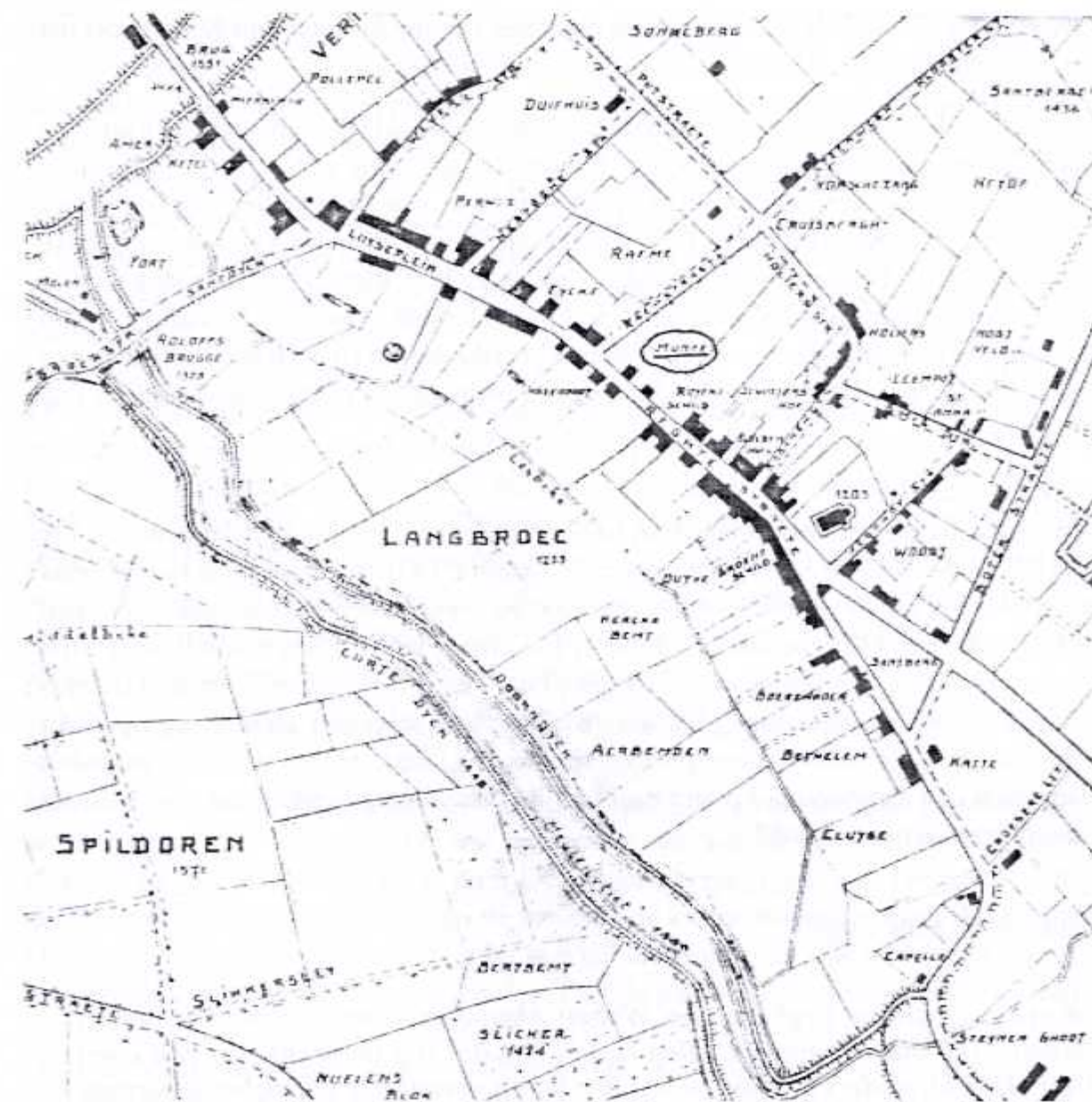
Kaart van Walem uit 1941 waarop de Munte gesitueerd wordt

Deze kaart is geen kopie van een historische kaart uit de tijd, maar ze werd in 1941 getekend door G. De Bruyne op basis van de resultaten van het onderzoek van A. Goetstouwers [9]. De historische correctheid van deze kaart moet dus in dit kader worden begrepen.