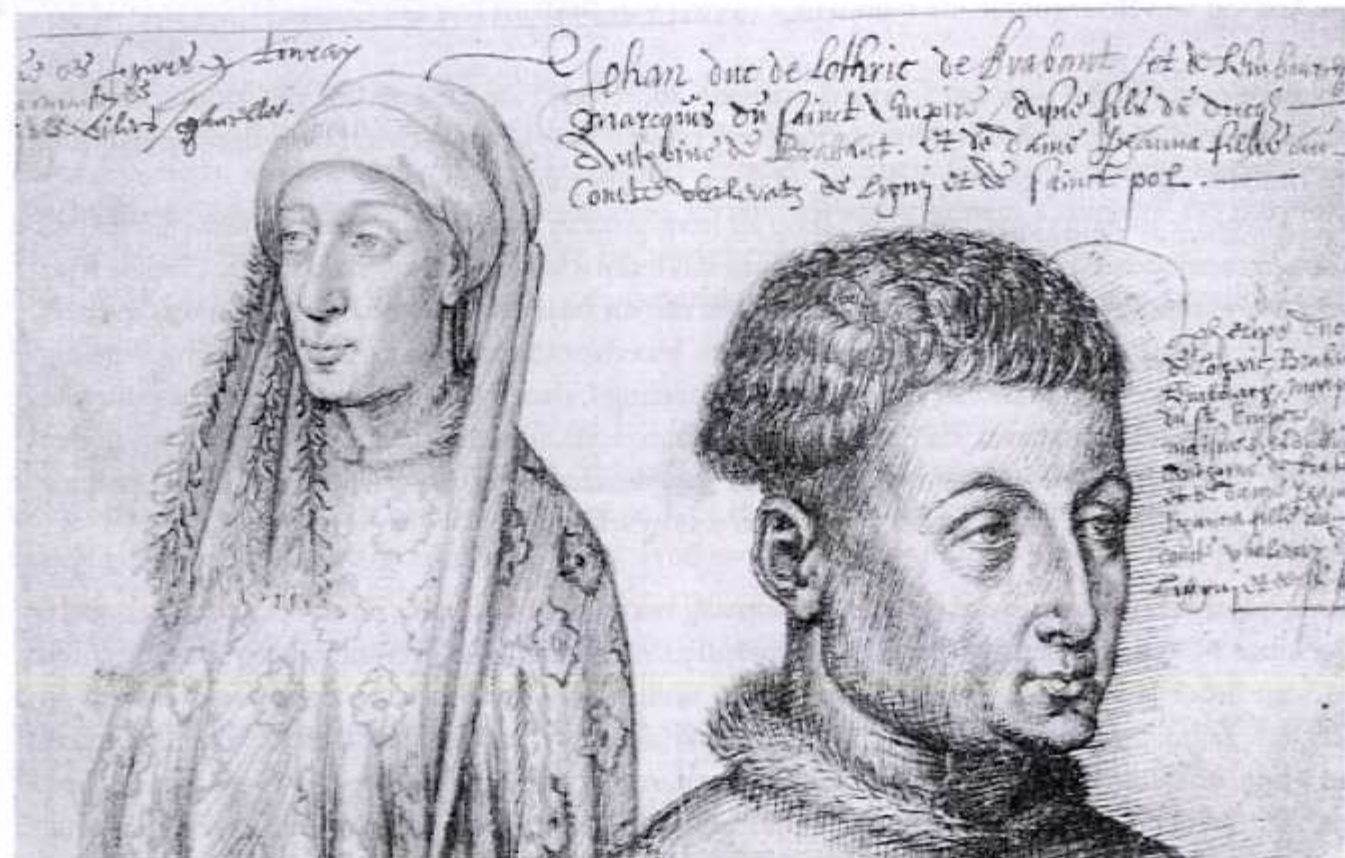
Jan IV en zijn jongere broer Philips van Saint-Pol Afbeelding door Antonio de Succa [18]

Aan het ruwaardschap van Filips van Saint-Pol kwam reeds een einde in de eerste maanden van 1422, toen Jan IV, Filips van Saint-Pol en de Staten van Brabant een verzoeningsverdrag 3/ sloten, waarbij Filips van zijn ruwaardschap afzag mits een "peyne" van 20.000 gouden kronen, en Jan IV in zijn macht werd hersteld.