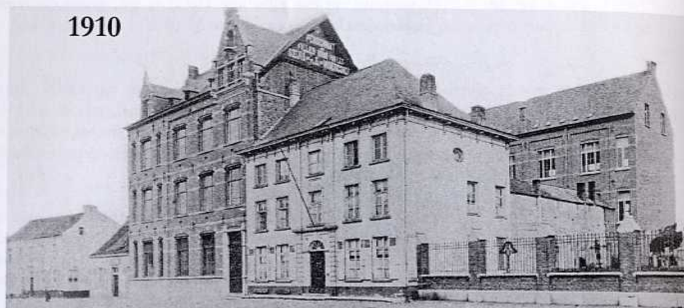
PENSIONNAT DES SŒURS DE N. D. DE MISÉRICORDE — WAELEHEM — FAÇADE COTÉ DE LA ROUTE.