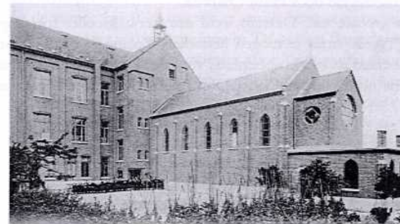
Buiten- en binnenzicht van de kapel

Op 28 april 1904, nauwelijks 5 jaar later, zal Walem alweer bezoek krijgen van Monseigneur Van der Stappen: hij komt dan de spiksplinternieuwe kapel wijden, begeleid door pastoor Bruynkens en onderpastoor De Bie.