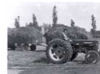
Zware landbouwtractot dd 1962

Midden de jaren vijftig werden enkele landbouwtractoren bijgekocht om de trekpaarden te vervangen welke aan een wel verdiende rust toe waren. Ook werd een zelflader aangekocht om de