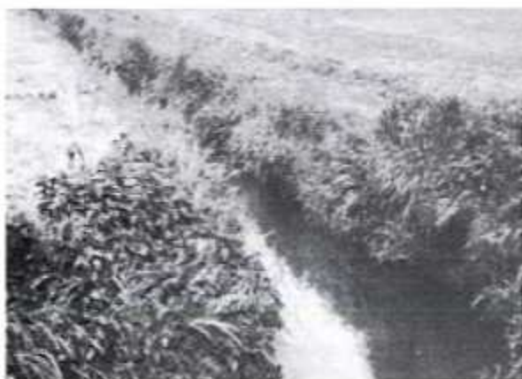
Gracht - kanaal voor bevoeding.

Het bevoeden van de weilanden gebeurde na elke maaibeurt per polder. Vloeibeemden laten een goede irrigatie toe welke niet alleen een optimale aan en afvoer van water toeliet, maar het bevoeden met rivierwater bracht ook slib (aluvium) op het grasland, wat de groei bevorderde. In het boek "De vrije aerde van Battenbroeck wijlen E.H.A. Goetstouwers" kunnen wij lezen "Battenbroeck dankt zijn vruchtbaarheid aan God en de Nethen".