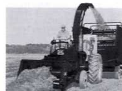
Zelfrijdende opraak-haksel- en laadmachine

zich wat een grote ontlasting was voor de paardenarbeid. Een tweede volgde onmiddellijk om een machine te trekken dat het gras op rijen bracht en zorgde voor het transport naar de fabriek. Het laden op de karren gebeurde nog steeds met de vork. Zuivere handenarbeid dus.