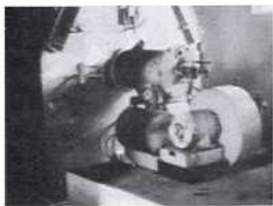
Oven met brander

De droogtrommels werden verwarmd door een oven in het begin gestookt met coques en nadien met zware stookolie. De laatste ovenbrander kon een warmte produceren van max. 1100°C. De normale benodigde temperatuur lag tussen de 600 en de 900°C afhankelijk van de vochtigheid van het aangevoerde gras.