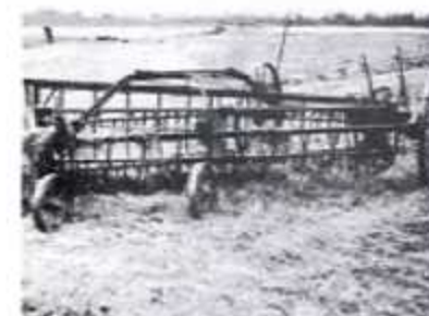
Regger (gras op rijen brengen)

Zo kwam er eerst een motor op de maaimachines waardoor de paarden nog enkel de kracht dienden te leveren voor het voortbewegen van de maaimachine en niet meer voor het maaien zelf. In het jaar 1947 werden de eerste landbouwtractoren aangekocht. De eerste nam het grasmaaien op