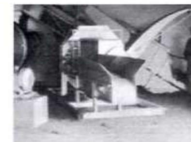
Hakselmachine in de fabriek

handen arbeid te verlichten. De techniek stond niet stil en zo werd begin de jaren zestig nogmaals nieuwe tractoren aangekocht samen met een super modern zelfrijdende machine welke het gras