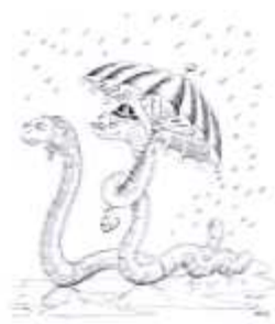
nukt as ne pier