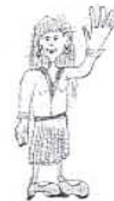
..oren en poten..