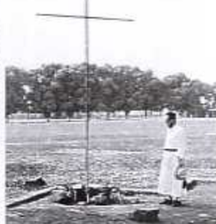
Gedenkteken op de missiepost

Op 25 januari werd in de St.-Michiel en St.-Goedelekathedraal te Brussel een plechtige dienst opgedragen door kardinaal Suenens ter nagedachtenis van de 20 missionarissen.