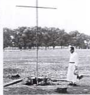
Gedenkteken op de missiepost

Op 25 januari werd in de St.-Michiel en St.-Goedelekathedraal te Brussel een plechtige dienst opgedragen door kardinaal Suenens ter nagedachtenis van de 20 missionarissen.