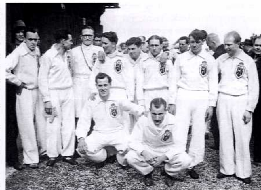
Action agentschap Brussel Parijs 1947 6Landencross Belgische ploeg

Veldrijden (ook wel cyclocross genoemd) is een wielersport waarbij de deelnemers met de fiets zo snel mogelijk een parcours afleggen. In tegenstelling tot het wielrennen zijn grote delen van het parcours niet geasfalteerd, maar rijden de renners door bossen en velden en over zandwegen. Het is toegestaan de fiets op de schouders te nemen en te lopen, bijvoorbeeld op te modderige stukken, of bij obstakels. De competitie vindt meestal in de winter plaats. Een wedstrijd bij de profs duurt een uur in de wereldbeker, bij andere grote crossen wordt er één ronde extra gereden.