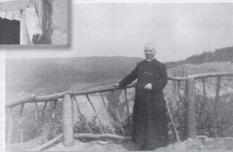
Uitstapje naar de Ardennen