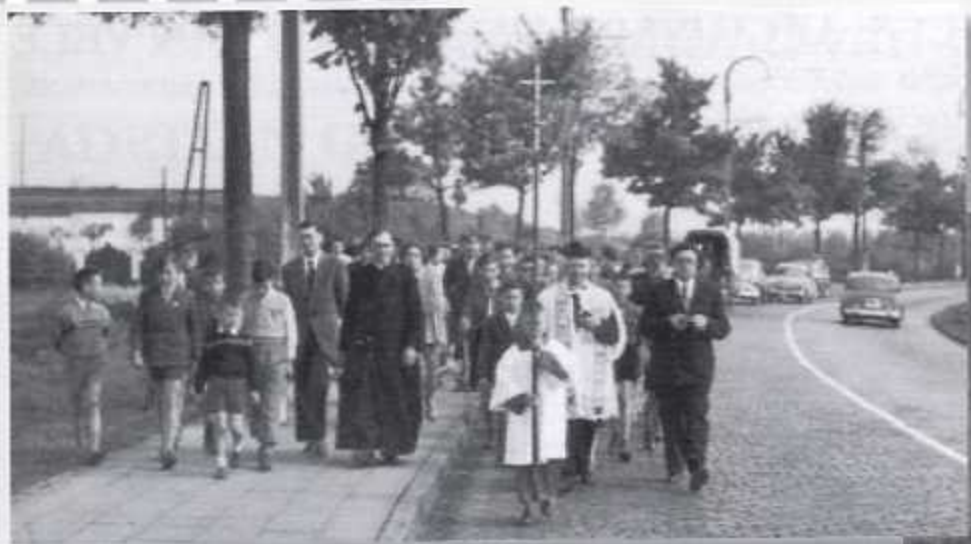
Op bedevaart naar Schorpenheuvel