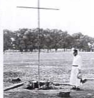
Gedenkteken op de missiepost

Op 25 januari werd in de St.-Michiel en St.-Goedelekathedraal te Brussel een plechtige dienst opgedragen door kardinaal Suenens ter nagedachtenis van de 20 missionarissen.