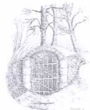
Toegang tot de ijskelder - pentekening Albert Verbiest

Die ijskelder was en is een ideale verblijfplaats voor vleermuizen.