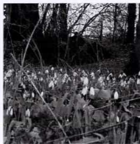
Sneeuwkllokjes op het domein